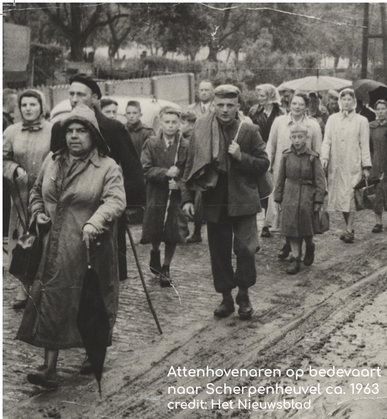
Attenhovenaren op bedevaart naar Scherpenheuvel ca. 1963

Het project Langs pelgrimswegen naar Scherpenheuvel zet de eeuwenoude bedevaartwegen naar Scherpenheuvel terug in de kijker.