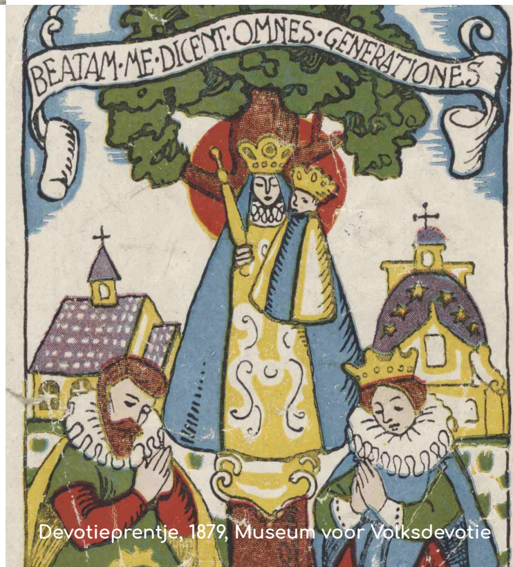
Devotieprentje, 1879, Museum voor Volksdevotie

V.U.: Interleuven | Jelle Thys | Brouwersstraat 6, 3000 Leuven